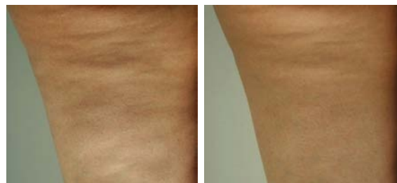
未使用 橘皮評分 3 級