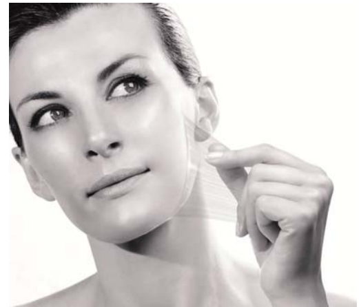
Epidermist 4.0 增加肌膚內在儲水能力