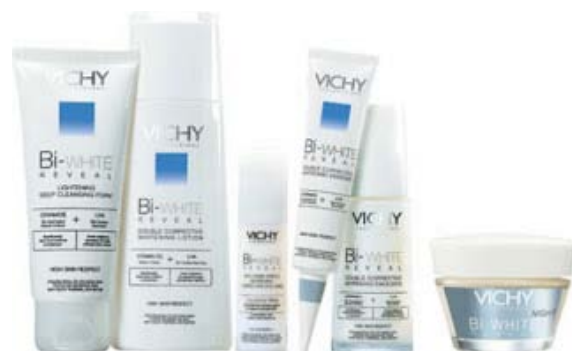
添加 Procysteine 的市場產品